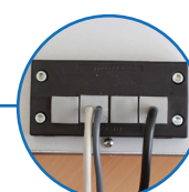
Presse étoupe fendu, gain de temps au montage