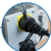
Connecteurs IP68 Serrage rapide manuel