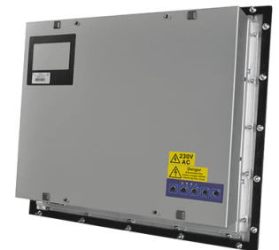
Version à encastrer

Le châssis en Inox et l'intégration de composants de qualités confèrent au produit des garanties de robustesse , de fiabilité et de pérennité . Ces matériels sont utilisés dans plusieurs domaines d'activité tels que l' agroalimentaire , la cosmétique , la chimie , l' industrie manufacturière .