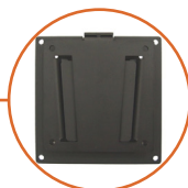
Montage VESA 75/100