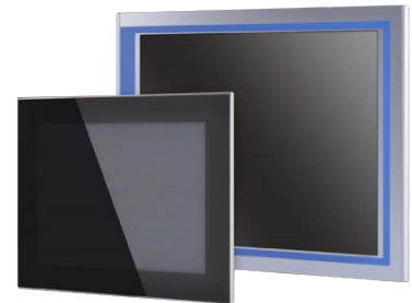
Écran P-Cap ou Résistif

Leur technologie tactile Résistive ou P-Cap en font des écrans haute performance aux fonctionnalités multiples.