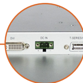
Alimentation 12V (option +24V)