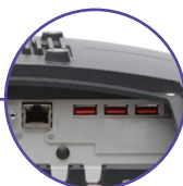
Ports USB 2.0 & port LAN