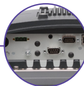
Port RS 232