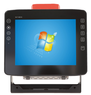
Tablette sur support

La Tablette PC industrielle 12" est un produit disposant des dernières technologies embarquées . Particulièrement robuste , ce produit est utilisable de manière optimale même dans les environnements les plus hostiles . Avec ses nombreux modules , ce produit remplit sa fonction d'appareil mobile en toute circonstance , s'adaptant parfaitement à un montage sur chariot élévateur .