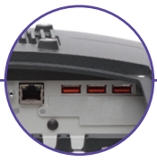
Ports USB 2.0 & port LAN