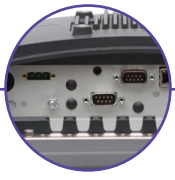
Port RS 232