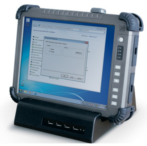
Tablette sur son dock

Avec ses nombreux modules , notre produit remplit sa fonction d'appareil mobile industriel.