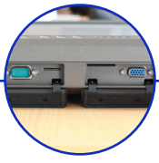
Port RS 232