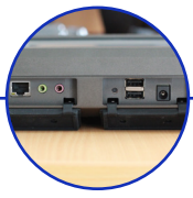
Ports USB 2.0 & port LAN