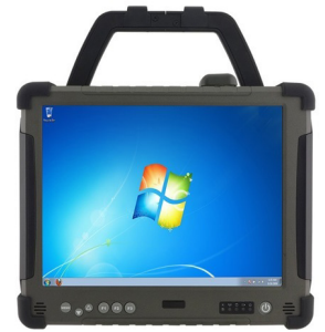
Vue de face de la tablette

Avec ses nombreux modules , notre produit remplit sa fonction d'appareil mobile industriel.