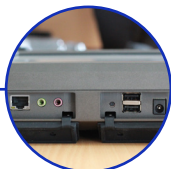
Ports USB 2.0 & port LAN