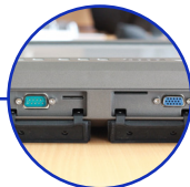
Port RS 232 & VGA